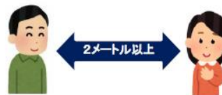
距離を保って、会話をする際はマスクは不要

屋内 距離が確保でき 会話をほとんど行わない場合をのぞき、 マスクの着用をお願いします。