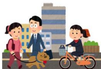
徒歩や自転車での通勤・通学など、人とすれ違う時も不要